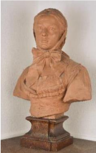
Auguste Huber, La diaichotte de Montbéliard , 1892, terre cuite, bois, en dépôt à la chorale folklorique Le Diairi.