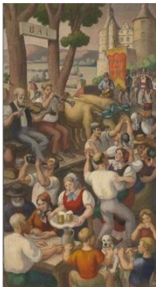
Jules-Emile Zingg, Fête au pays de Montbéliard , 1937, panneau décoratif, huile sur toile, Musées de Montbéliard.