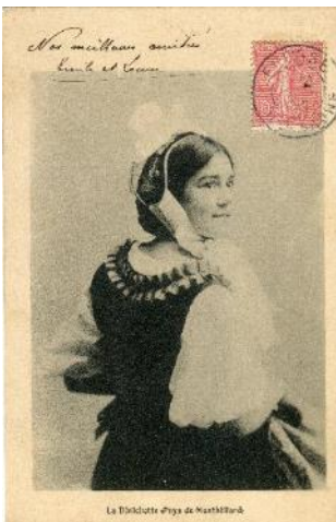
La diaichotte (Pays de Montbéliard) , années 1890, carte postale