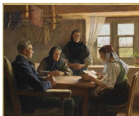
Georges Bretegnier, La lecture de la Bible , 1892, huile sur toile, dépôt Société d'Émulation de Montbéliard.