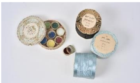
Rubans et perles de verre, collection privée.