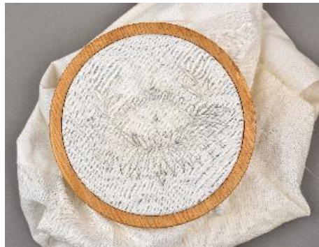
Ouvrage de broderie blanche en cours de réalisation, collection privée.