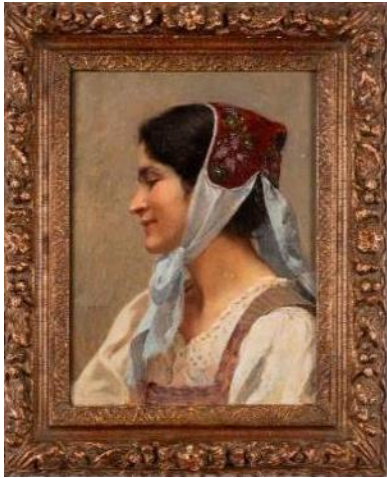
Georges Bretegnier, Diaichotte , 1891, huile sur toile, dépôt Société d'Émulation de Montbéliard.