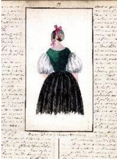
Mathieu Pierre Etienne Hennuy, Paysanne luthérienne du comté de Montbéliard , 1846, dessin aquarellé illustrant un manuscrit intitulé "Histoire du pays de Montbéliard", Archives municipales de Montbéliard