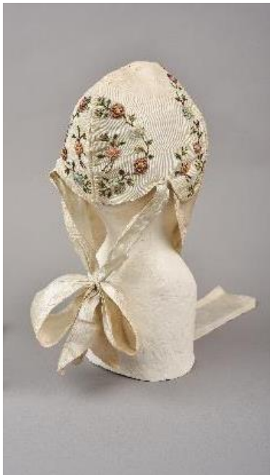
Cale à diairi, 19 e siècle, taffetas de soie moiré, brodé au ruban de taffetas de soie, fil de soie floche, cannetille diamantée et rubans en satin de soie, Musées de Montbéliard.