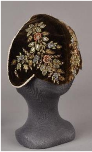
Cale à diairi, 19 e siècle, velours de soie ou de coton, brodé de fil chenille de soie, cannetille diamantée, perles de verre, cabochons, Musées de Montbéliard.