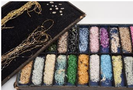
Présentoir à perles de verre, collection privée.