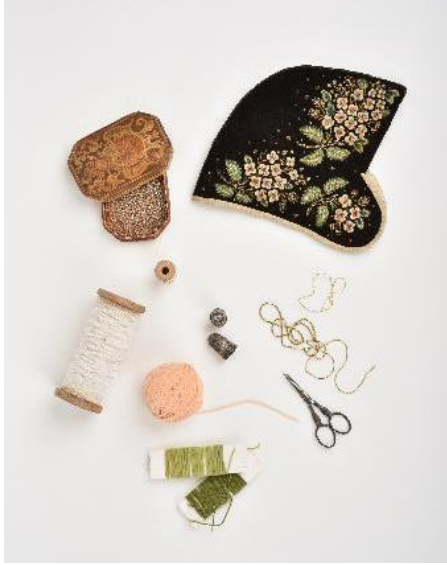
Cale à diari (Musées de Montbéliard), accessoires (collections privées)